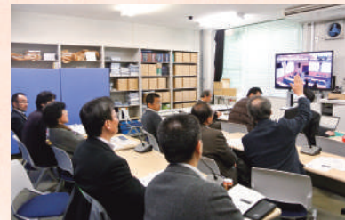
テレビ会議システムを使った 修士論文審査