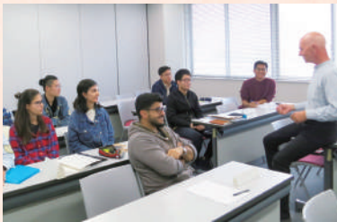
Native English Speaking Teachers による少人数実践英語教室